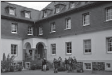
Clubreisweekend in de Eifel