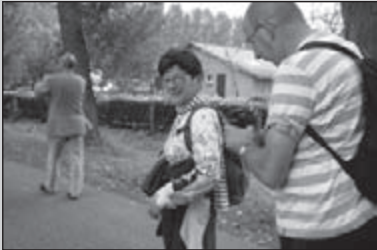
Werken aan het Grendijkjespad

CLUBBLAD VAN WSV OLAT • JAARGANG 34 • NUMMER 11 • NOVEMBER 2008