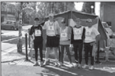
De 28 uur van Roubaix