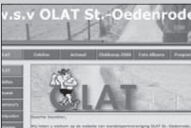
Vernieuwde website olat.nl

Tijdens de winterserietocht in Boekel staken veel wandelaars een kaarsje op in de Esdonkse kapel